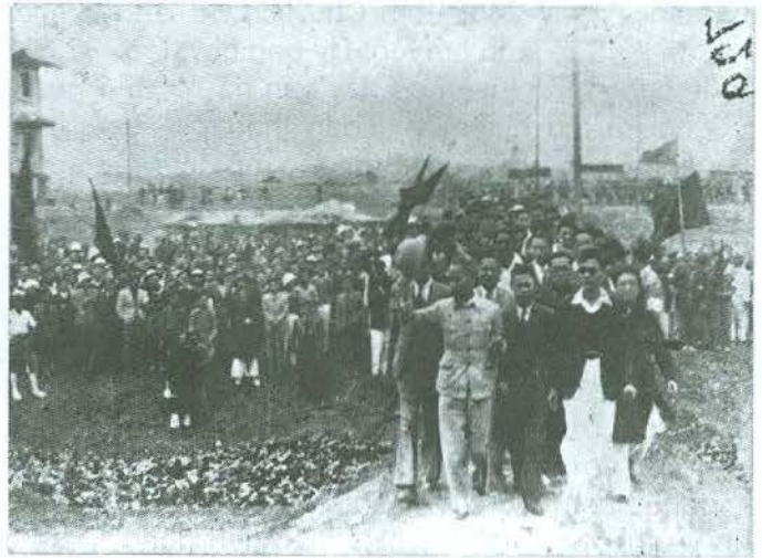
Tại Việt Nam học xá, ngày 05/01/1946. Chủ tịch Hồ Chí Minh giải thích và kêu gọi nhân dân Tổng tuyển cử

Với tầm nhìn xa trông rộng và sự lãnh đạo tài tình sáng suốt, khoa học của Chủ tịch Hồ Chí Minh, ngay trong những ngày đầu thành lập nước, Người đã đề nghị “tổ chức càng sớm càng hay cuộc Tổng tuyển cử với chế độ phổ thông đầu phiếu” 1 bầu cơ quan quyền lực cao nhất - Quốc hội của